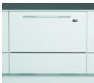
Version Tout Intégrable (Porte habillable)

(1) Programmes : Rinçage, Très sale, Délicat, Rapide, Normal, Très sale ECO, Délicat ECO, Rapide ECO, *Normal ECO.