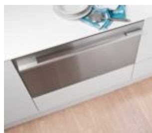
Version Designer (Porte inox sans traces)

Dimensions (en mm) de l'appareil - hors poignée