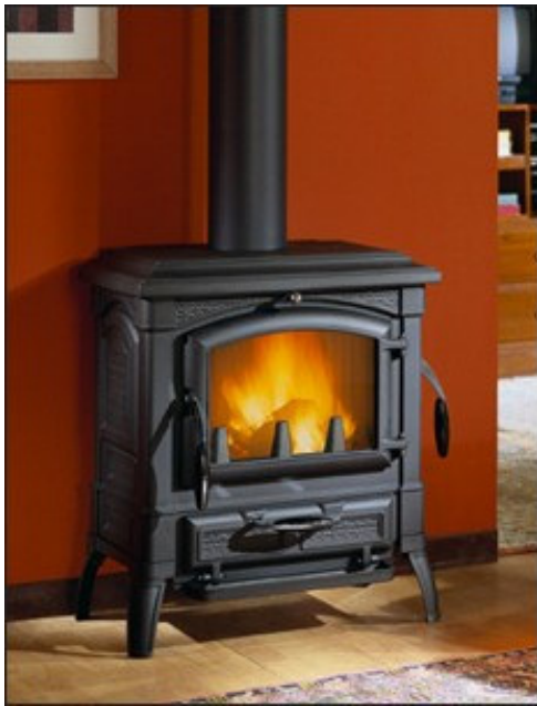
Tout fonte : noir mat