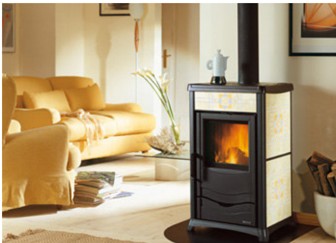
Finition céramique à motifs : bordeaux ou crème