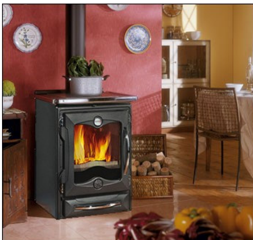
Façade tout fonte : noir mat ou crème mat