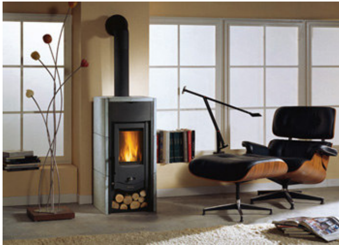
Finition : Pierre ollaire , céramique ( bordeaux ou crème )