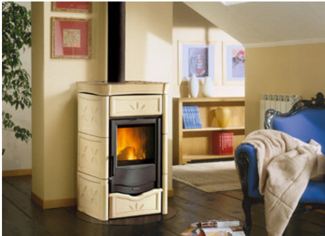
Finition céramique épaisse : bordeaux ou crème