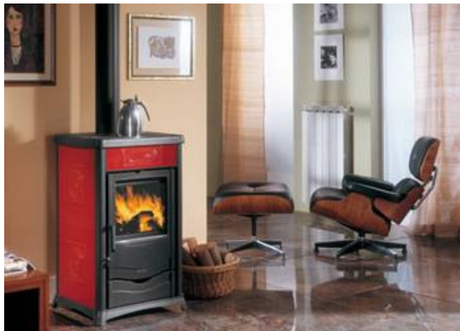
Finition Pierre ollaire* ou céramique bordeaux ou crème