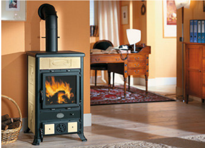
Finition Pierre ollaire* ou céramique bordeaux ou crème