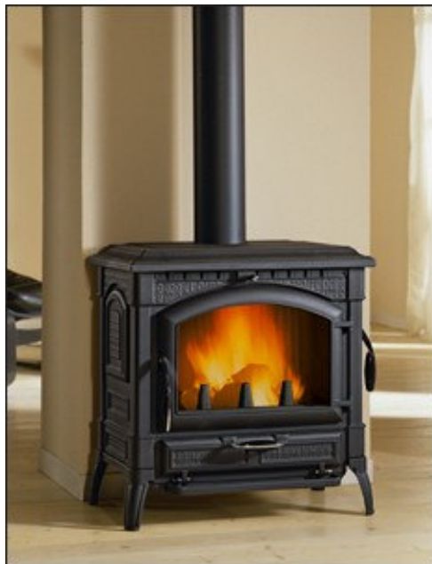
Tout fonte : noir mat

Foyer à 2 ouvertures (frontale et latérale) pour faciliter le chargement