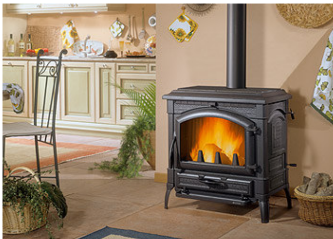
Tout fonte : noir mat