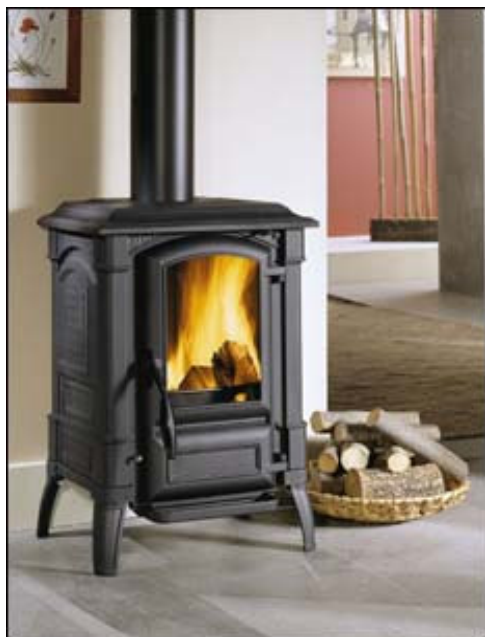
Tout fonte : noir mat

Poêle permettant de cuisiner grâce à son plan de cuisson en fonte